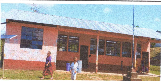
Foto 3: Aplicación a dos manos de pintura en exterior del establecimiento.