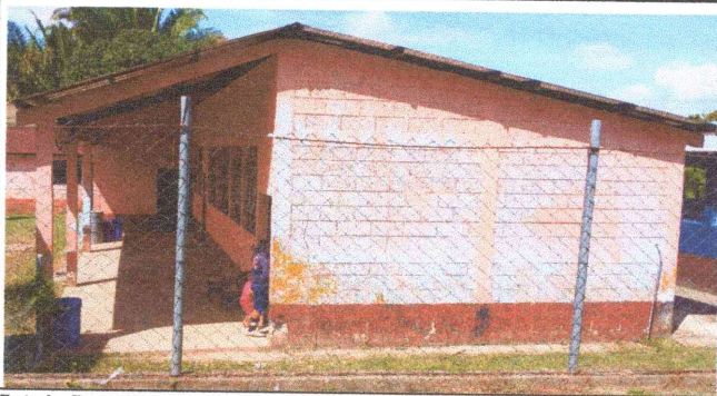
Foto 1: Desmontaje e instalación de cubierta de lamina por deterioro.