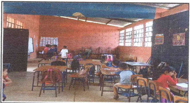
Foto 4: Aplicación a dos manos de pintura en interior del establecimiento.